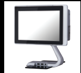
T3 mit erweiterter UP Basis