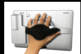
Abnehmbar für mobile Einsätze